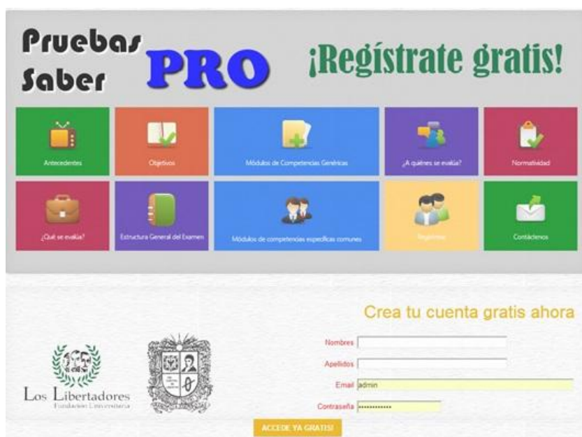
Gráfica 1. Pantallazo de plataforma e-learning , para la e-evaluación

En el periodo 2013-1, en la Facultad de Ingeniería, del proyecto curricular Ingeniería de Sistemas se presentaron 37 estudiantes que optaron por participar en la plataforma, en la competencia específica de Ingeniería de Software.