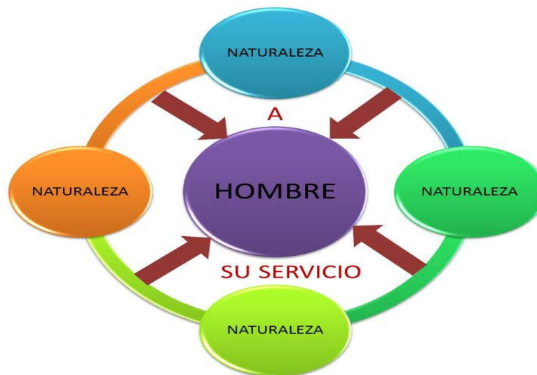
Gráfico 1. Concepto Antropocéntrico

Es común encontrar en la teorías sobre desarrollo una mirada disyuntiva y antropocéntrica que ubica al hombre en el centro de la naturaleza, como lo ilustra el gráfico 1, pero el acercamiento conceptual de biodesarrollo propone correlacionar las diversas dimensiones que se dan simultáneamente en una región de manera transdireccional; es decir, a través de las relaciones posibles entre las especies -donde la humana, es una más- y los otros componentes de la biosfera dando paso a una postura biocéntrica que sitúa la vida en el centro.