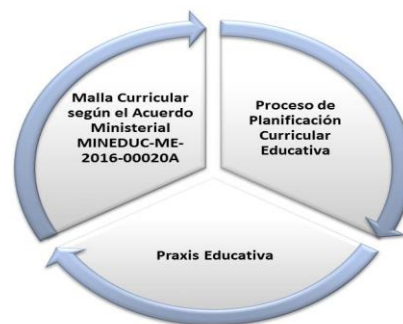
Figura. 11. Dimensiones de la Investigación.

De esta manera se sintetiza las entrevistas realizadas a los actores sociales conformados por doce (12) docentes "S", en relación a las dimensiones que comprenden cada categoría de estudio codificada, conformando una triada donde existe una correspondencia necesaria para proponer un Plan de Capacitación del docente en Planificación Curricular dirigido a la Unidad Educativa en Quito – Ecuador. (Ver Figura 11)