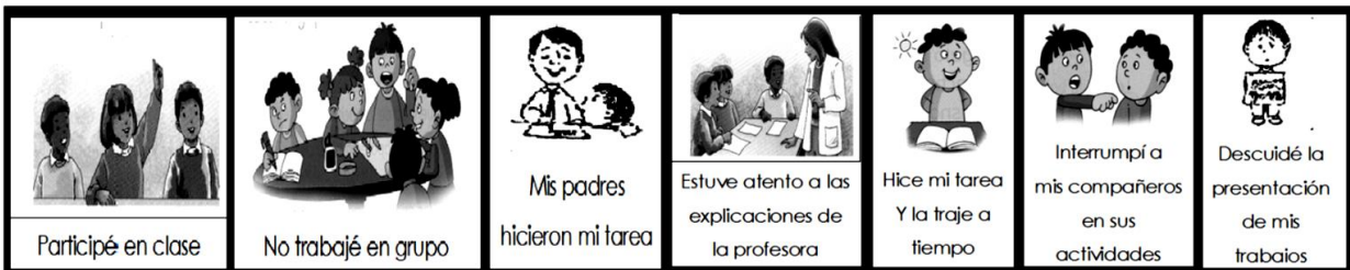
Imagen 2. Recurso para autoevaluación

Auto-Evaluación. Chulea la(s) imagen(es) que evalúa(n) tu trabajo: